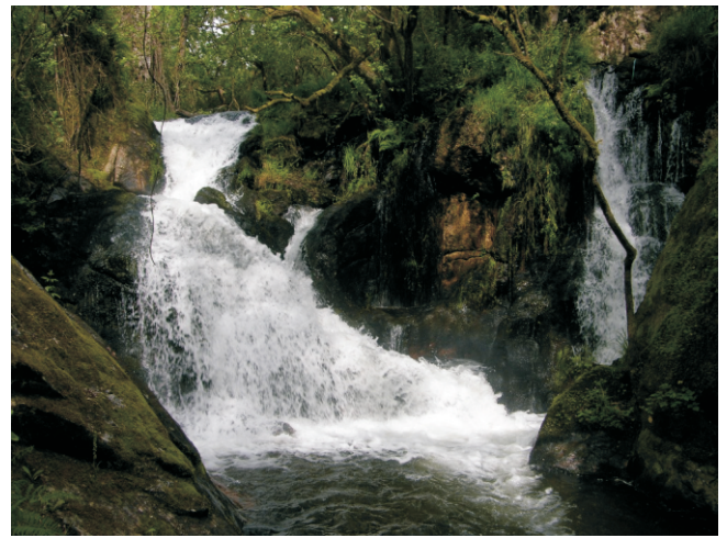
Picho da Fervenza

Na N-640 da Estrada a Silleda, a uns 3 km, en Cimadevila (Callobre) séguese a estrada vella nunha curva e cóllese a terceira pista que sae pola dereita e chega a unha carpintería e a un antigo serradoiro hidráulico onde se deixa o coche. Desde alí báixase por un carreiro á primeira fervenza. Pódese facer unha ruta circular seguindo o río (que hai que cruzar varias veces) que remata na parte alta da fervenza de Valiñas.