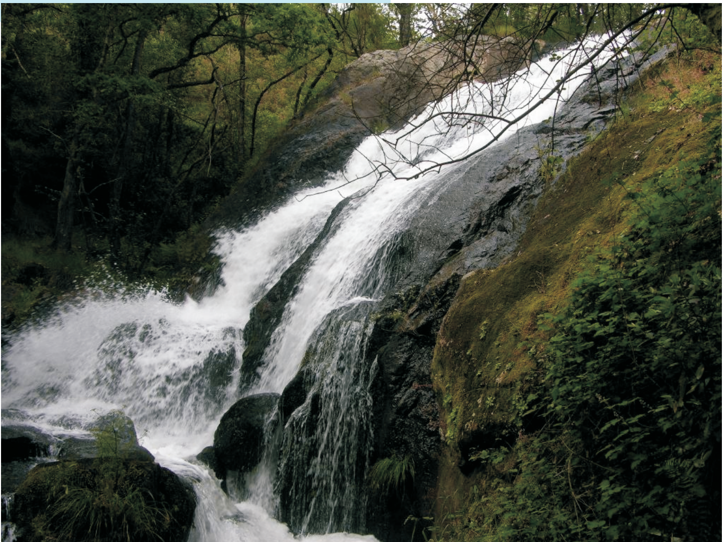
Fervenza de Valiñas

Para ir á parte baixa desta fervenza séguese pola pista de terra que hai á dereita (fronte á carpintería) ata chegar á ponte que cruza o río. Logo hai que ir por un carreiro de moita dificultade pola marxe dereita e pódese baixar á fervenza grande e outra que hai un pouco máis abaixo.